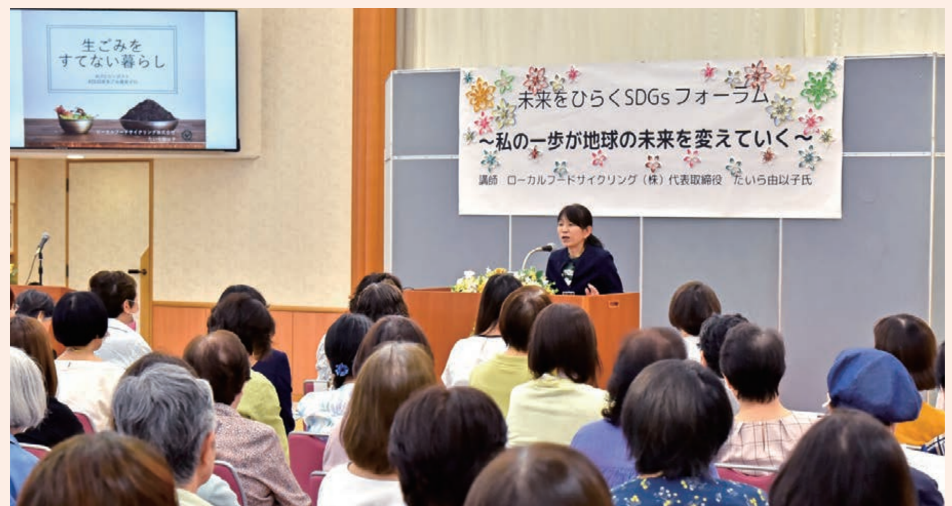
女性平和委員会は、各地でSDGsフォーラムを開催する中で「女性のエンパワーメント」を推進