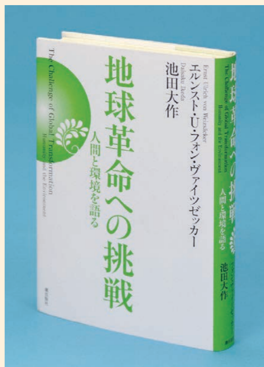
元ローマクラブ共同会長で世界的な環境学者のエルンスト・フォン・ヴァイツゼッカー博士と