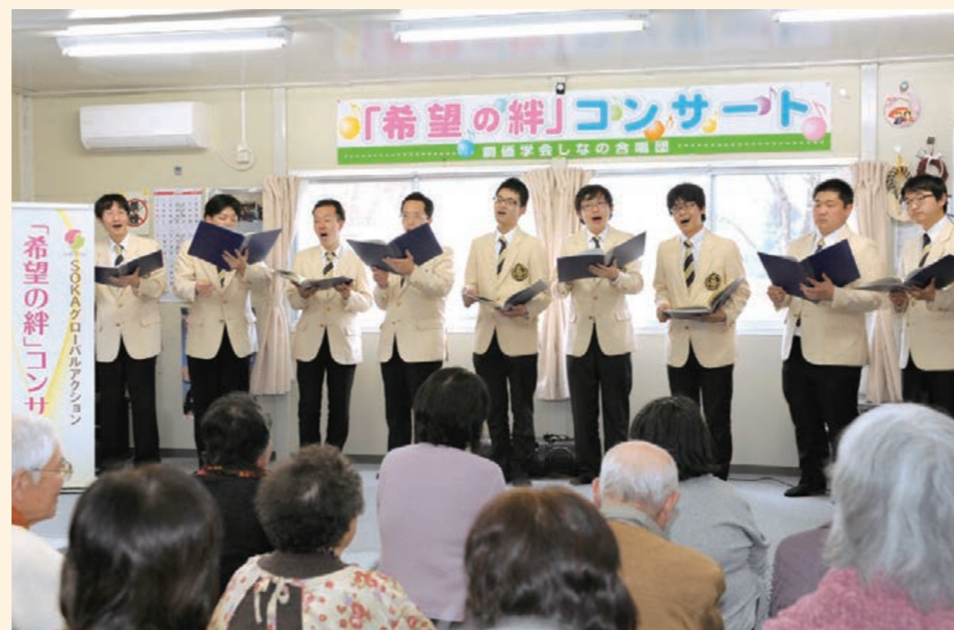
音楽隊・しなの合唱団による「希望の絆」コンサート (2014年、福島県内の仮設住宅の集会所にて)