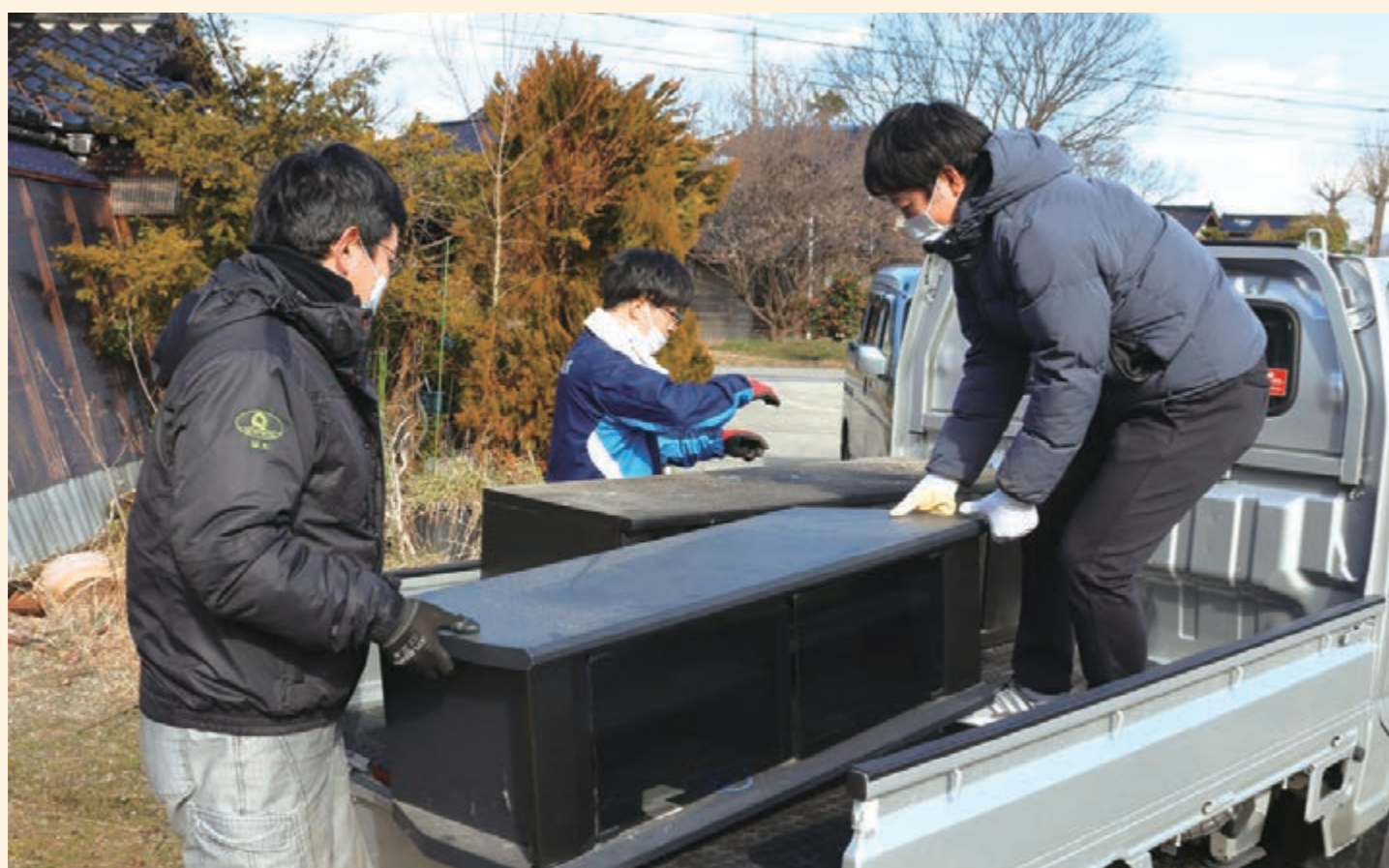
「かたし隊」によるボランティアの清掃活動 (2024年、石川県)