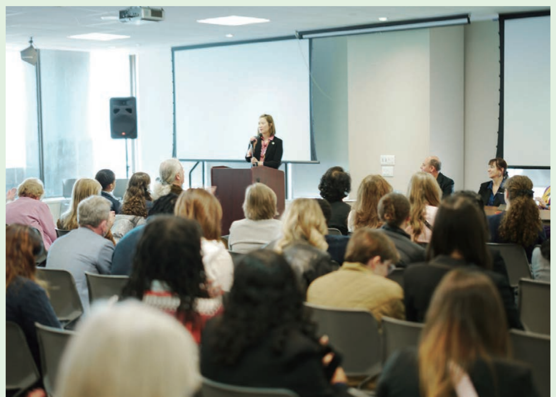
国連女性の地位委員会に際し関連行事を開催 (2024年、ニューヨーク)