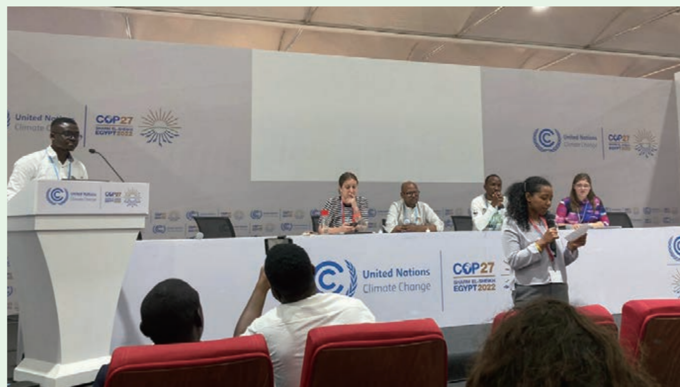
COP27でユースの役割について議論 (2022年、エジプト)