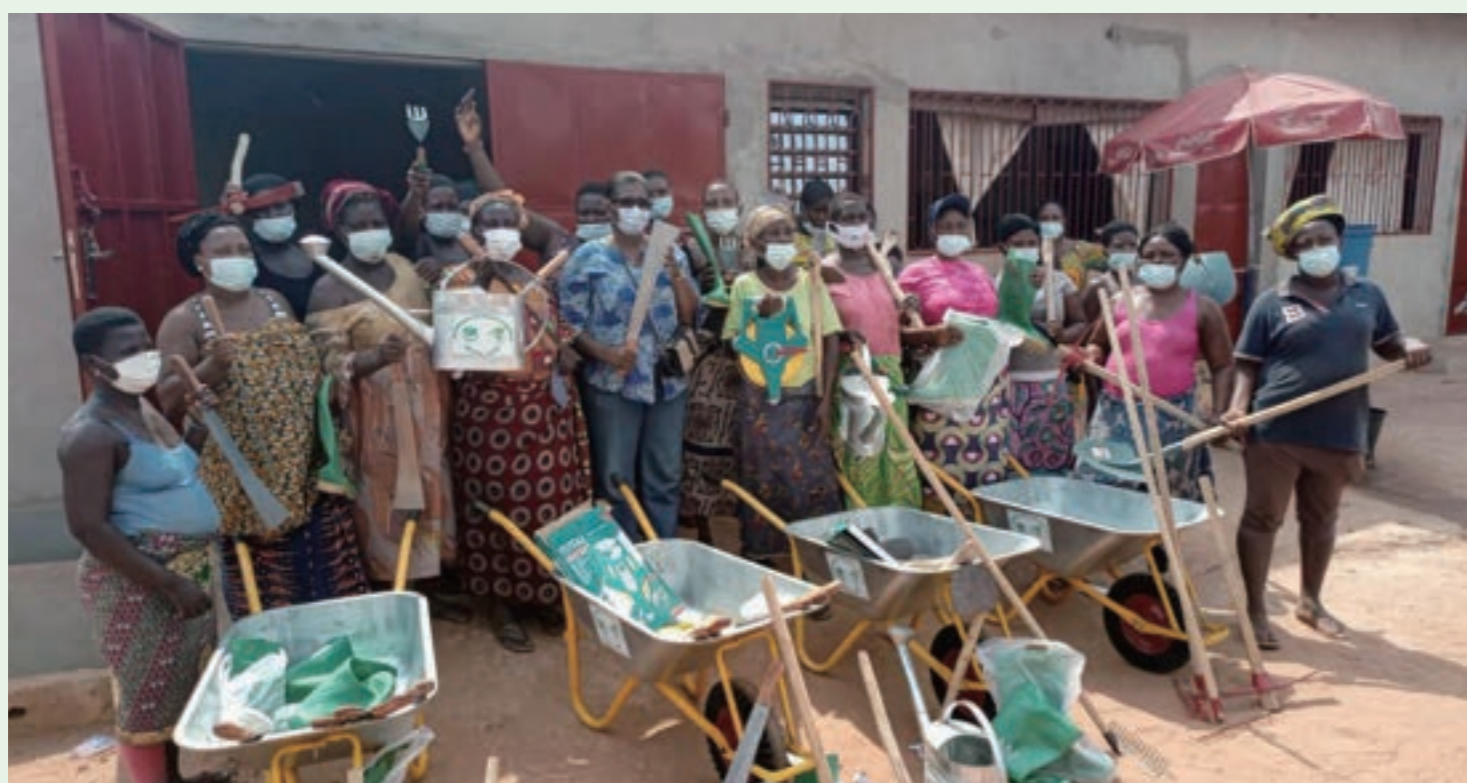
国際熱帯木材機関(ITTO)等と共同で森林再生プロジェクト を推進。ジェンダー平等などにも貢献(2023年、トーゴ)

そのほかにも、この問題に取り組む宗教間や青年のネットワー クなどに参加。それらを踏まえ、毎年の国連気候変動会議 (COP)にも参加して、具体的な意見を伝えているんだ。