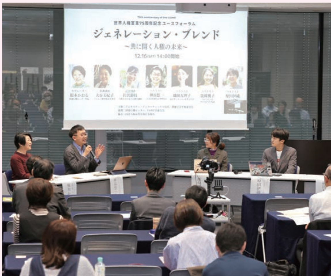
創価学会平和委員会が、アムネスティ・インターナショナル日本と、人権に関する「ユースフォーラム」を開催(2023年)