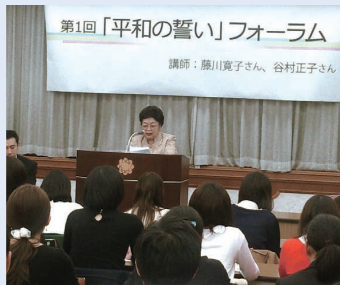
青年が被爆体験を聞く会を全国各地で