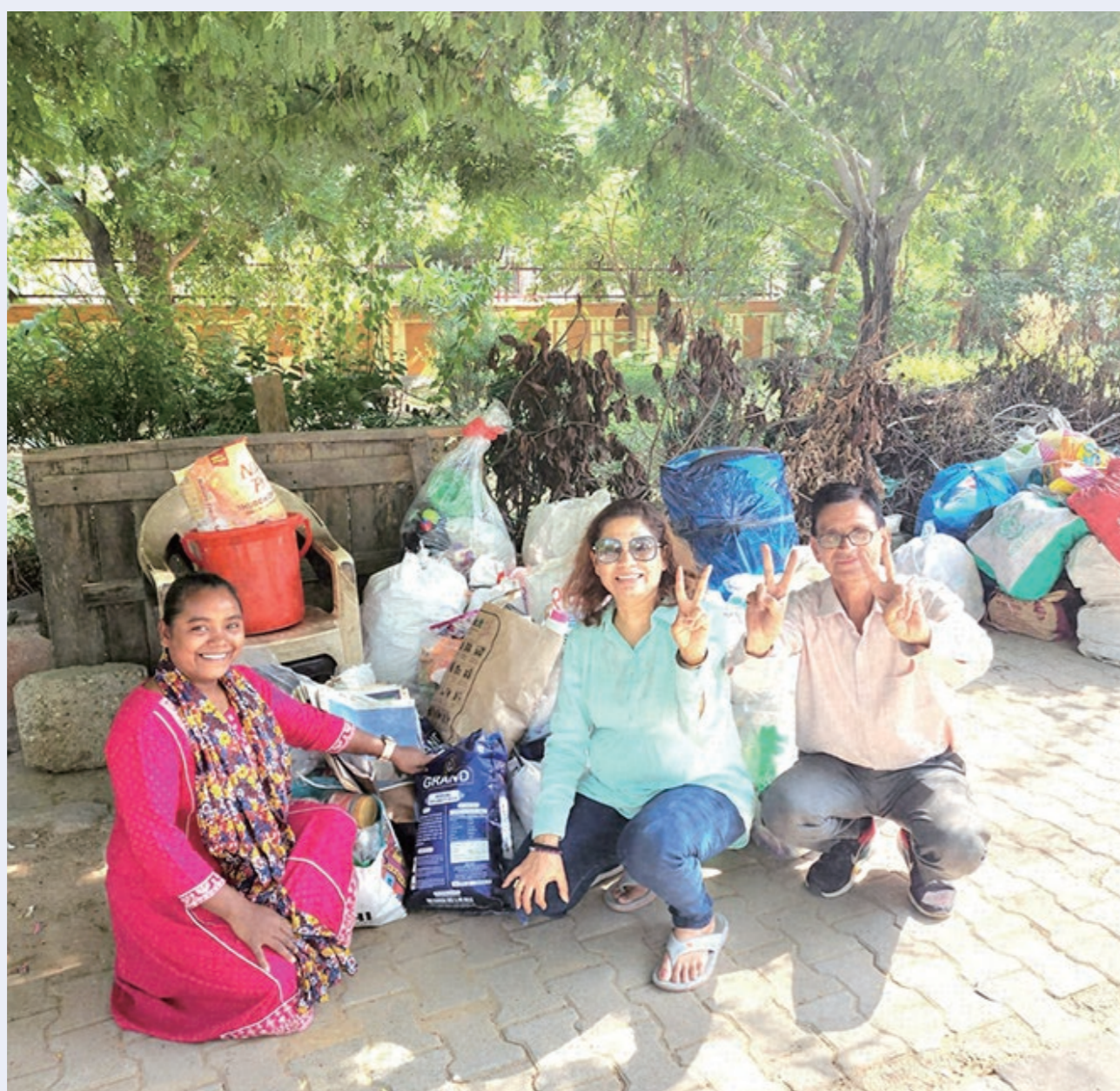
デリーでは25トンのプラスチックを回収

インド創価学会(BSG)は、SDGsと自分の生活を照らし合わせながら一人一人の挑戦を促すキャンペーン「BSG for SDG」を展開中です。取り組む一人一人の内面の変革にも光を当てています。