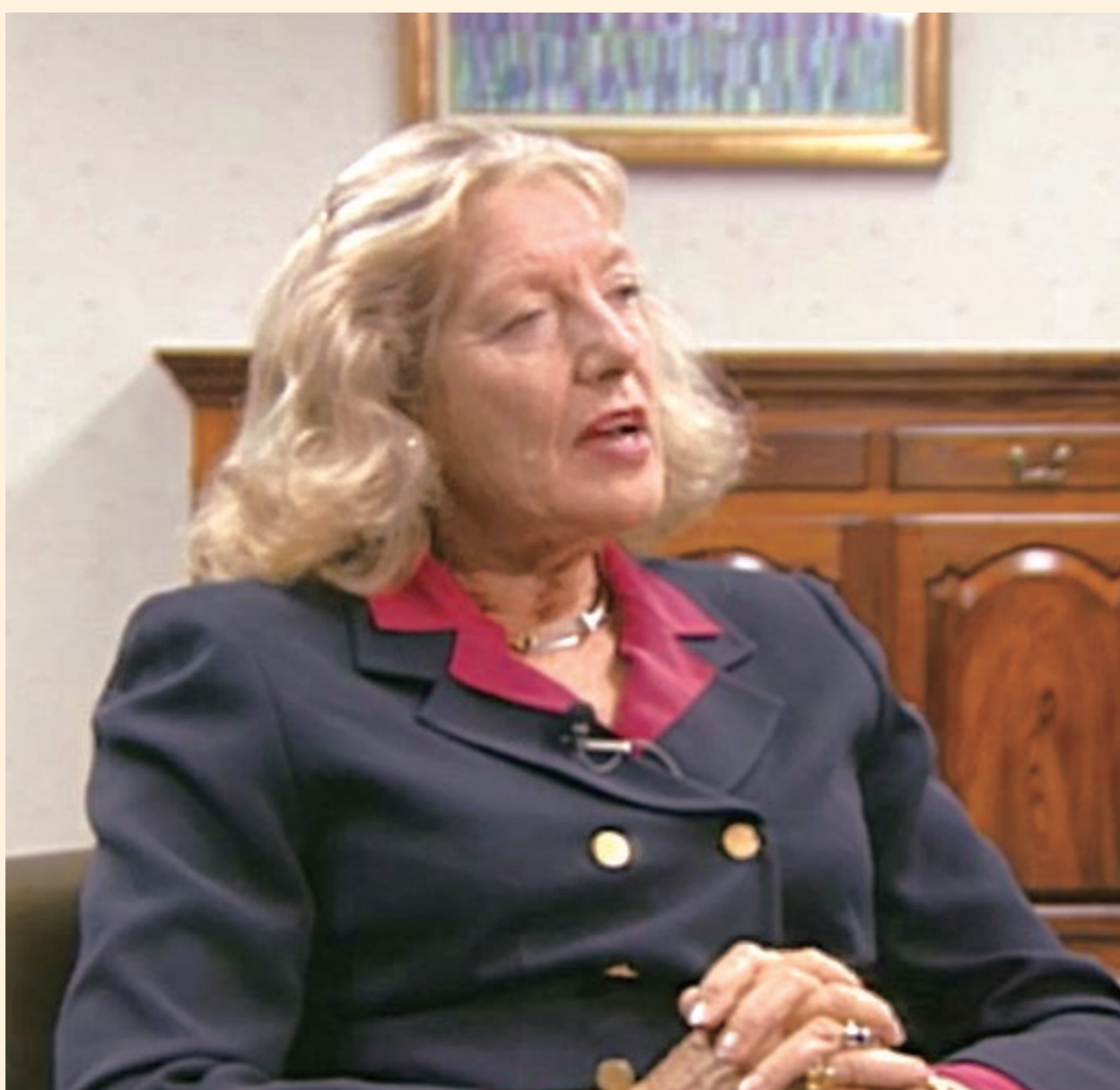
アメリカの市民運動家ヘイゼル・ヘンダーソン博士と対談集「地球対談 輝く女性の世紀へ」を発売