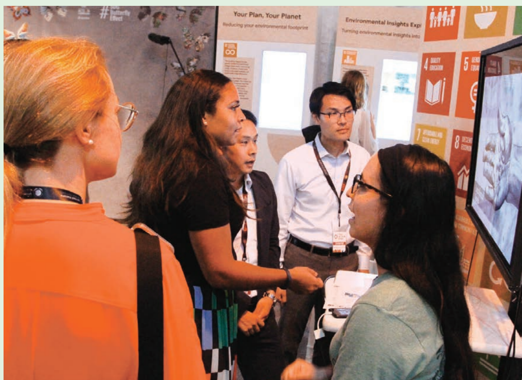
国連気候行動サミットに際しブースを出展 (2019年、ニューヨーク)

また、創価学会国際(SGI)は国連NGOとして、SDGsをめぐる国連の議論に活発に参加しています。