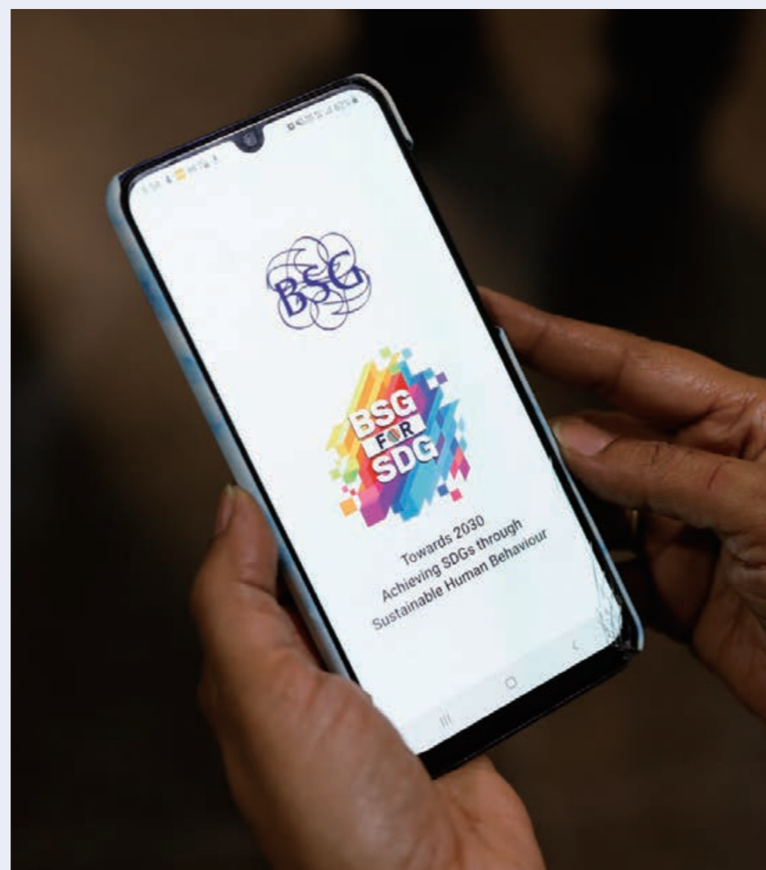
専用アプリで情報を共有