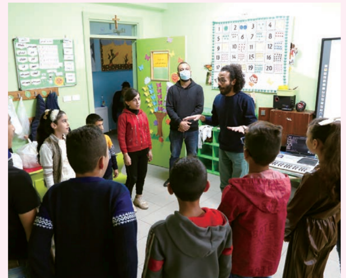
ヨルダンでの音楽教育プロジェクト。難民など、教育を受けづらい環境にある子どもたちを支援