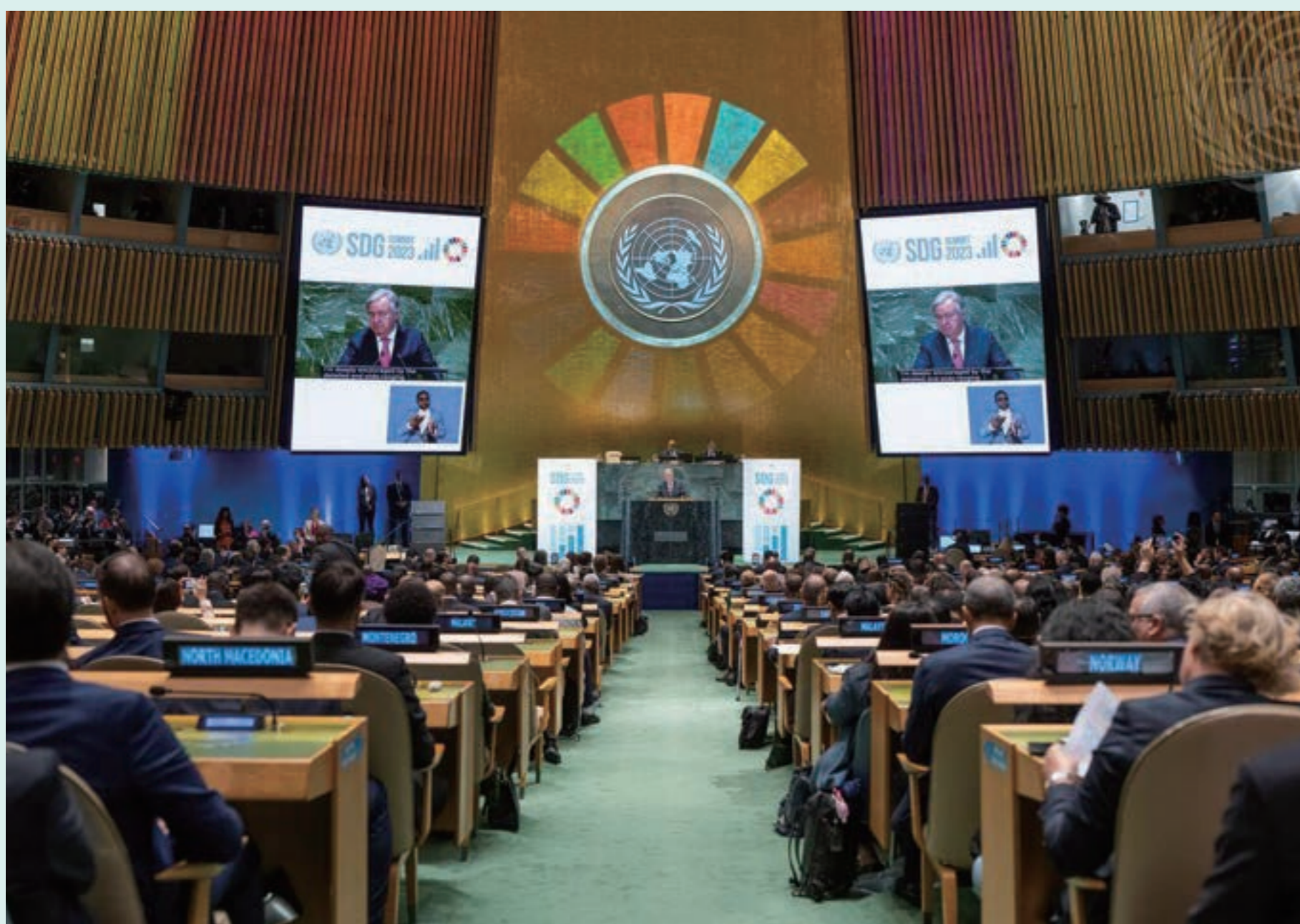
国連本部でのSDGsサミット(2023年)