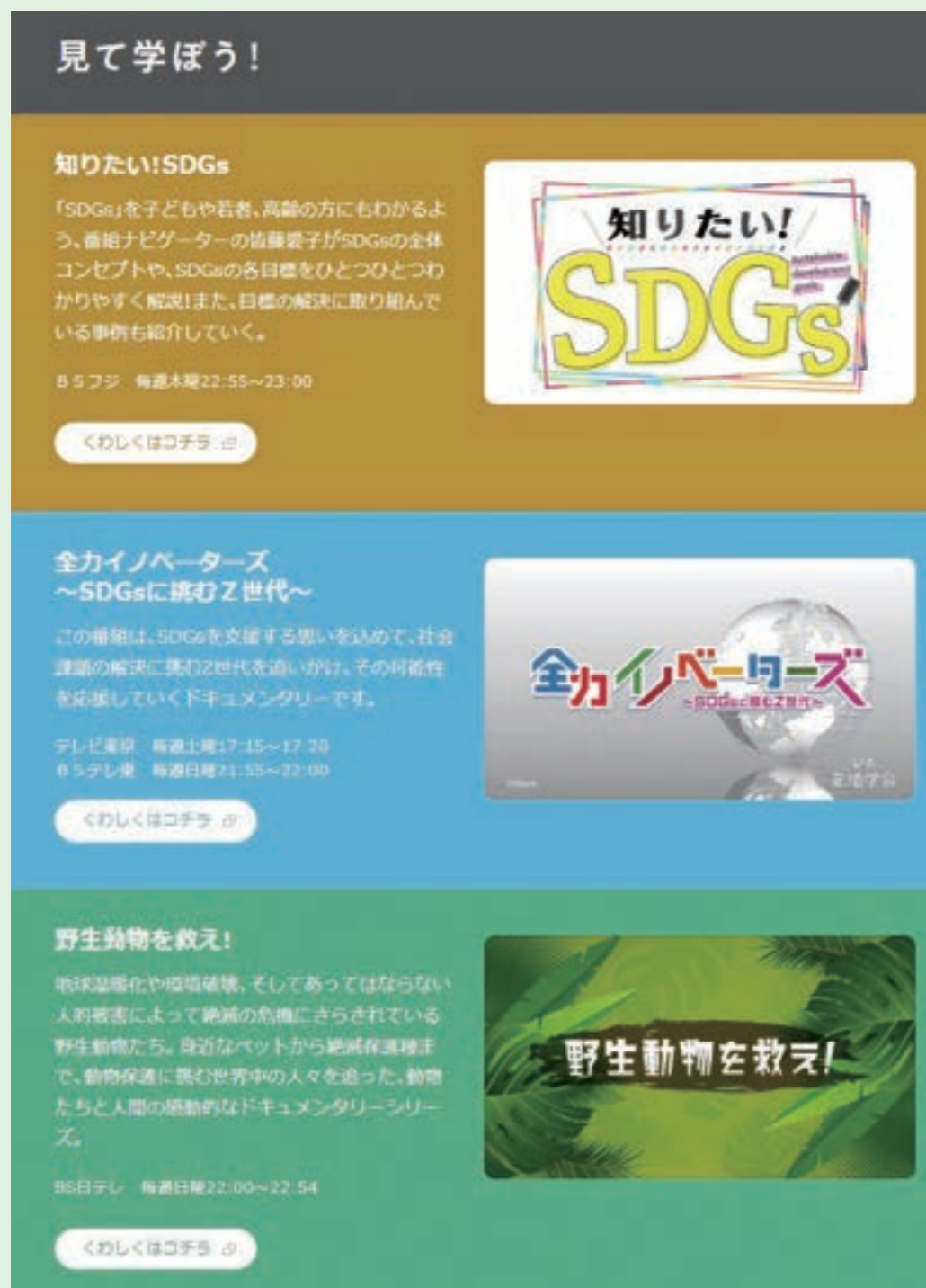
創価学会提供のテレビ番組が放映中

いまや多くの人を知っているSDGsですが、学会は、2015年の制定以来、さまざまな機会を通じて啓発に取り組んできました。