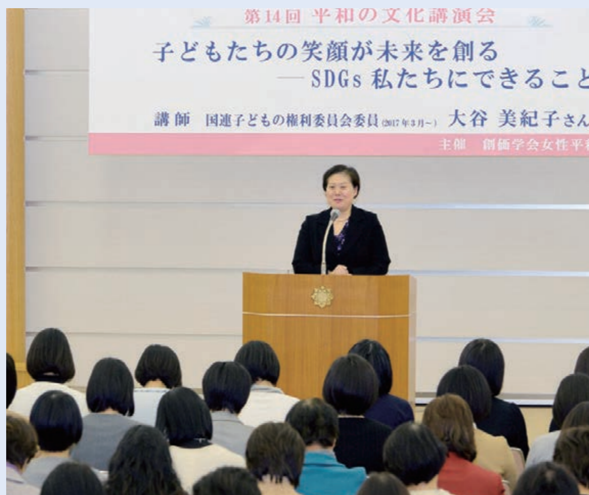
女性平和委員会が、「子どもの権利」への理解促進のフォーラムを開催

被爆体験を聞く会などをやってきたし、2017年に採択された「核兵器禁止条約」については、市民社会の一員として議論にも参加。ついに2021年に発効して国際法になったんだ。さらに加わる国が増え、理念が普及するように頑張っているよ。