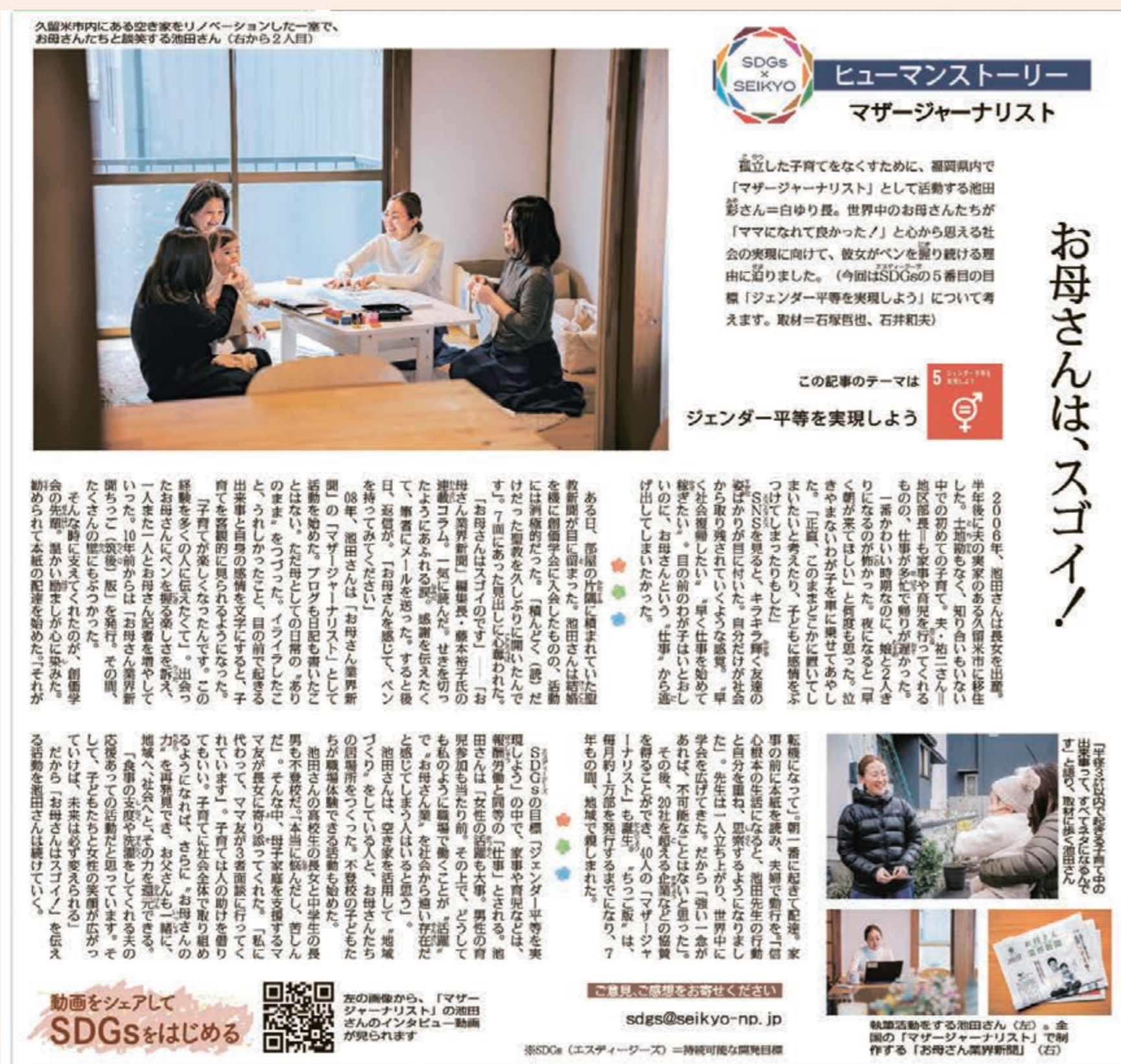
「ジェンダー平等」に関する聖教新聞の記事

聖教新聞でも、ジェンダー平等や女性のリーダーシップについてたくさん取り上げてるわね😊