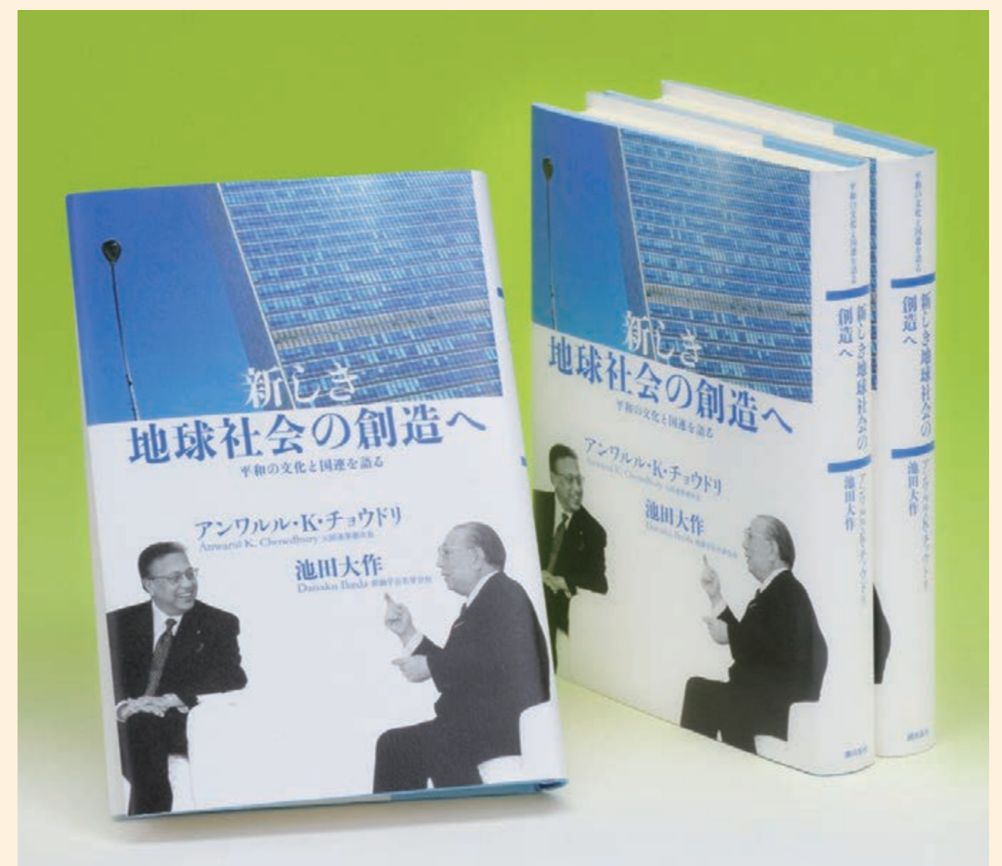
アンワルル・チョウドリ元国連事務次長と

戦争やテロは、人間への暴力である。環境の破壊は、自然への暴力である。それぞれ別の問題ではない。根は一つである。