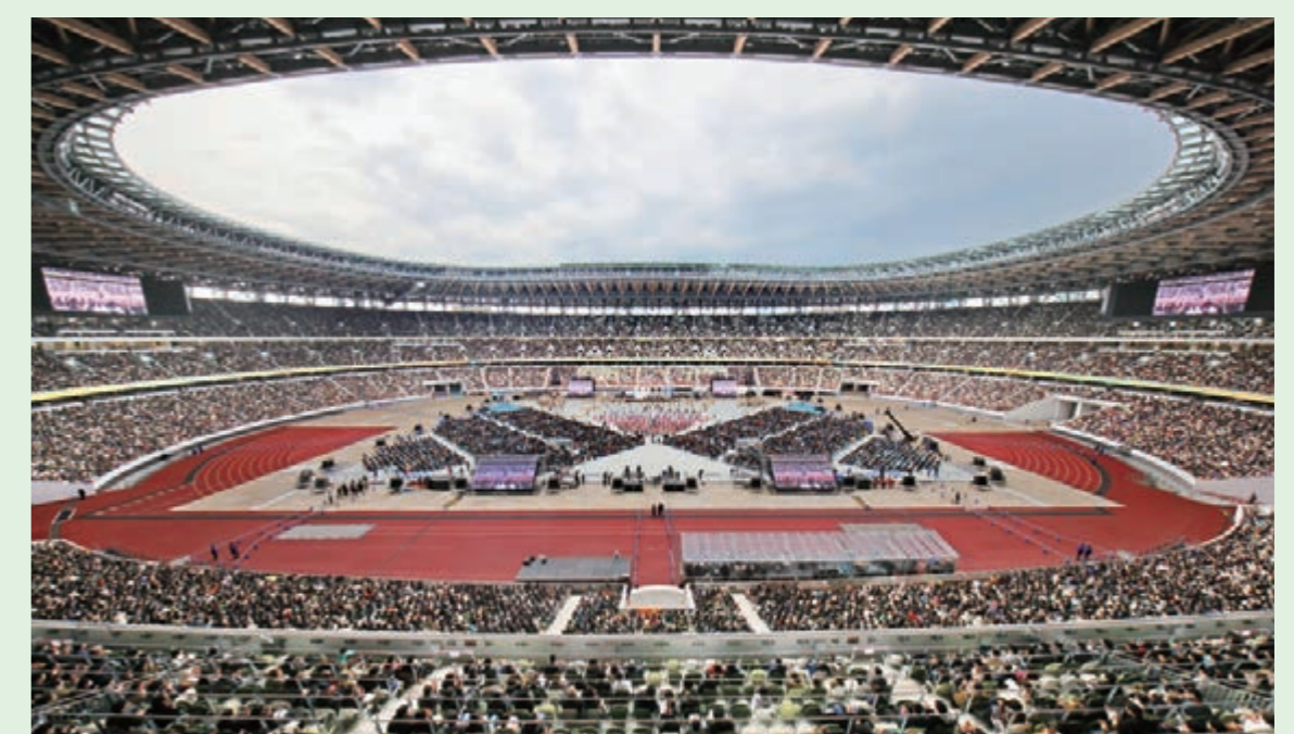
未来アクションフェス(2024年、国立競技場)

また、創価学会国際(SGI)は国連NGOとして、SDGsをめぐる国連の議論に活発に参加しています。