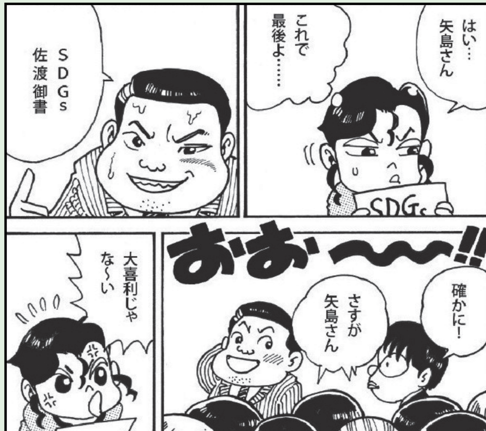
聖教新聞紙上の漫画「はなさん」 ©まっと・ふくしま