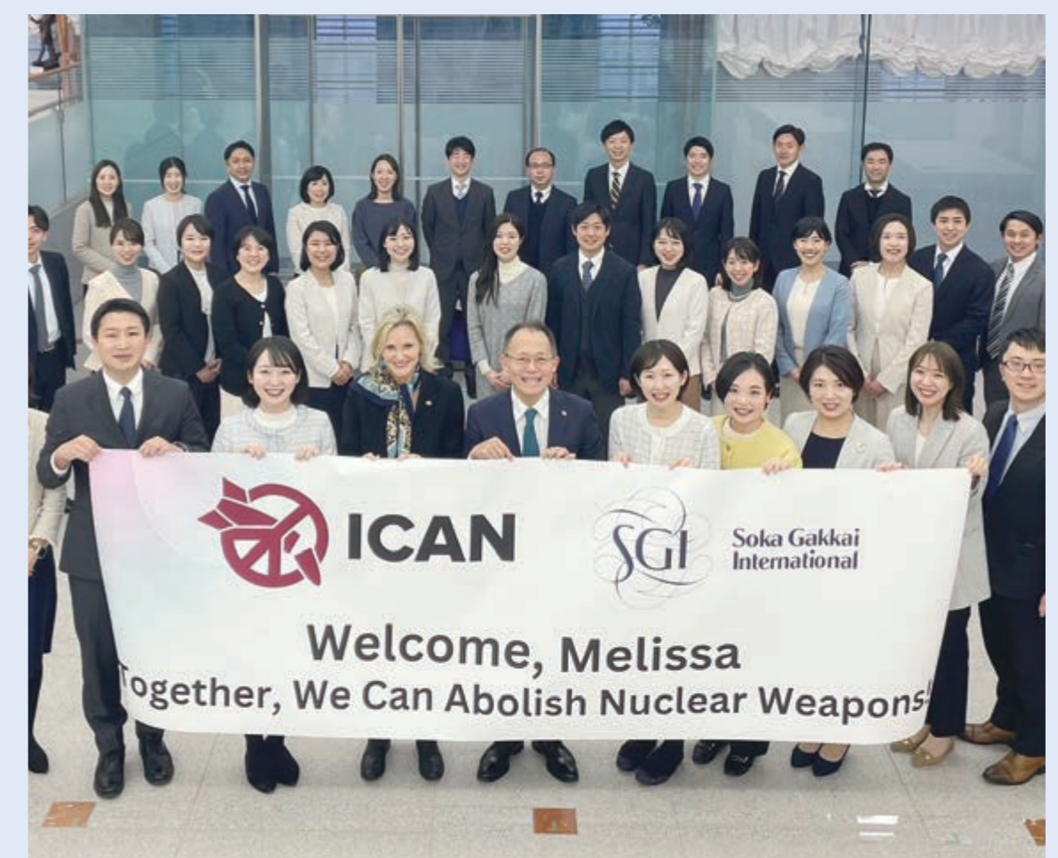
ノーベル平和賞を受賞した核兵器廃絶国際キャンペーン(ICAN)には、その創設時から参加