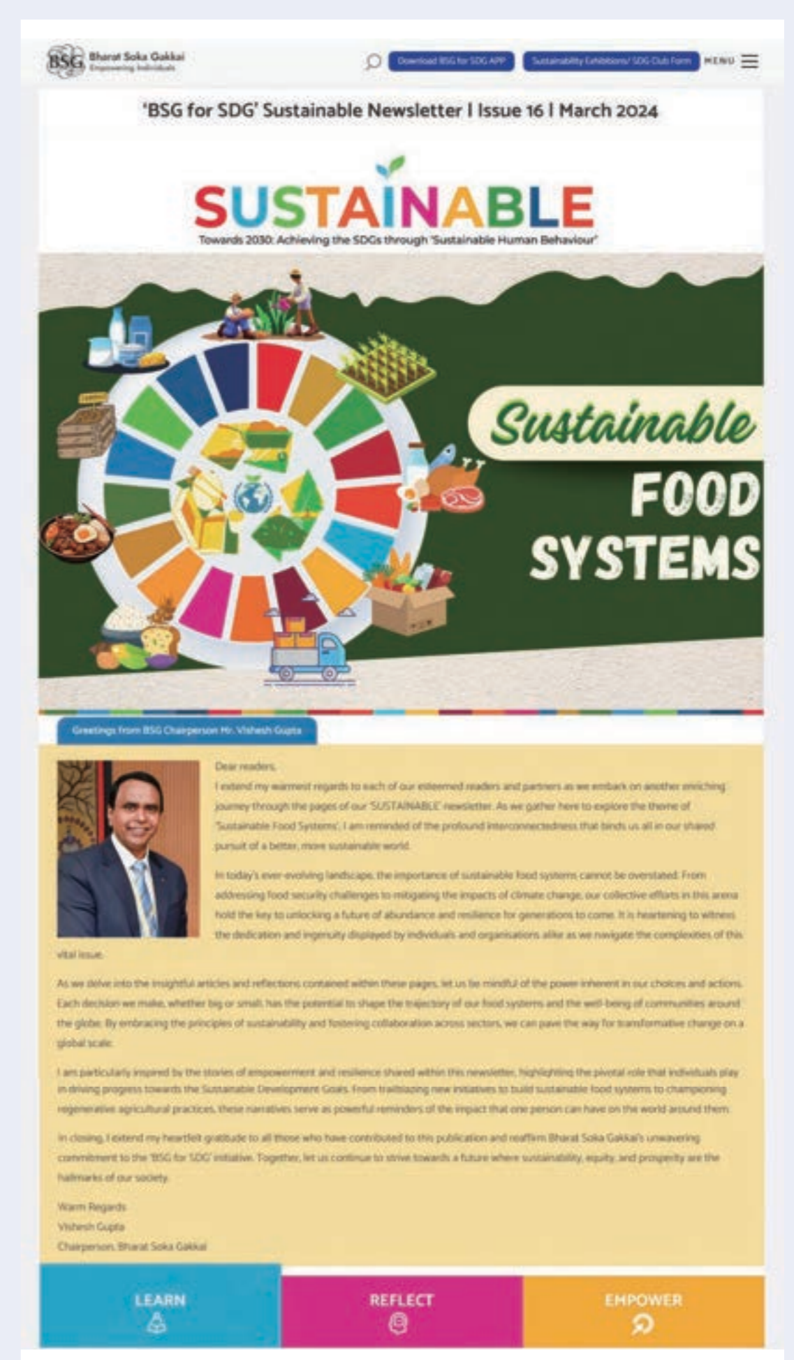
インド創価学会のウェブサイト