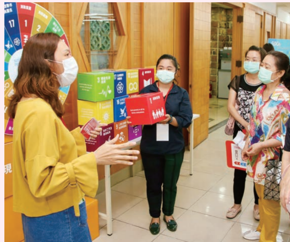
世界各地での展示会。SDGs関連では「希望と行動の種子」展を地球憲章インタナショナルと共同制作し展開中