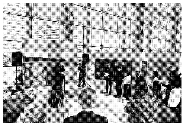
カザフスタン共和国の首都アスタナで昨年9月に行われた「核兵器なき世界への連帯」展。SGIとICANの共同制作による展示は、戸田第2代会長の「原水爆禁止宣言」発表65周年を迎えた同月、メキシコのグアナフアト大学でも開催された

その上で、「原水爆禁止宣言」発表50周年を迎えた2007年からは「核兵器廃絶への民衆行動の10年」をスタートさせて、同時期に世界的な活動を立ち上げていたICAN（核兵器廃絶国際キャンペーン）などと連帯しながら、核兵器を禁止するための条約の実現を目指してきたのです。