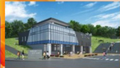
厚田の街に誕生した道の駅にもレッツゴー!

【見頃時期】 コスモス: 9月中旬～10月上旬 モミジ・カエデ: 10月上旬～中旬 イチョウ・ツツジ・桜の葉: 10月中旬～下旬