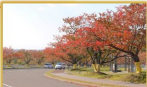
H-I墓域の桜の葉が真っ赤に染まる。この先には雄大な日本海のパンoramaが