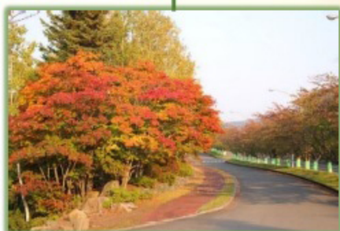
記念広場から園内奥に走る幹線道路沿いには、真っ赤に燃えるツツジや桜の葉、モミジが続く