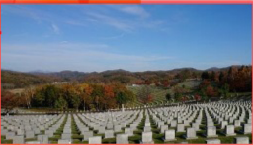
記念広場の立像の裏側に足を運ぶと雄大な厚田の景色が広がる