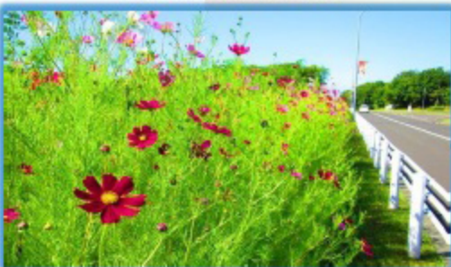
9月中旬になると管理センターの前には約200メートルに渡ってコスモスが咲き薫る