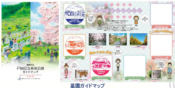
墓園ガイドマップ