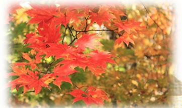
園内各所にモミジがあります