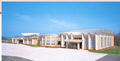
墓園全景ジオラマ

はじめに管理センターで、園内案内図や墓園ガイドマップ（中面にスタンプラリーシートあり）をゲットして出発しましょう！センター内の中央ラウンジには墓園の全体を一望できるジオラマがあります。