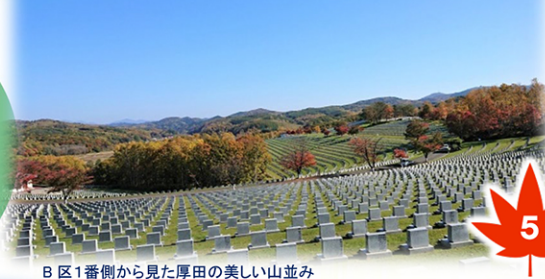
B区1番側から見た厚田の美しい山並み