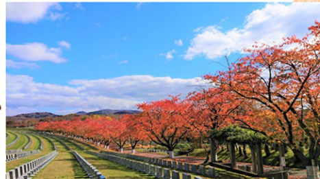
春には満開の桜を楽しませてくれる「桜冠の道」。秋には桜の葉が真っ赤に燃え上がる（車両の高さ制限 2.3m 以下）

広い園内には紅葉の見どころがいっぱい。ゆっくり車を走らせながら、モミジ狩りドライブを楽しみましょう！