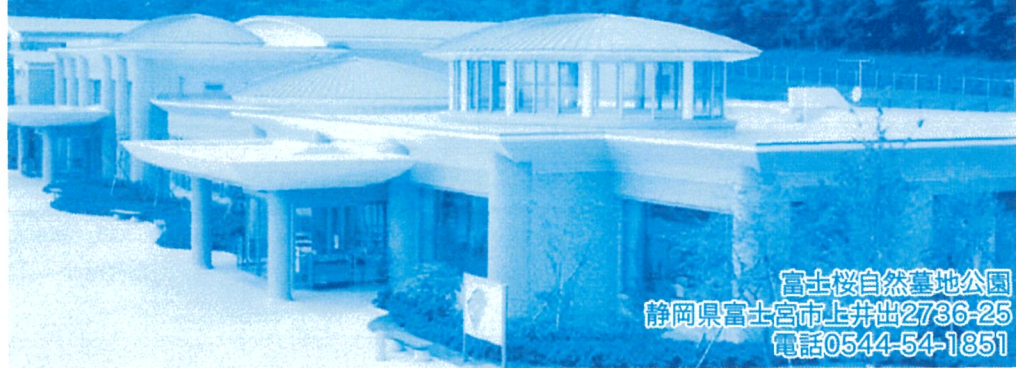
富士桜自然墓地公園 静岡県富士宮市上井出2736-25 電話0544-54-1851