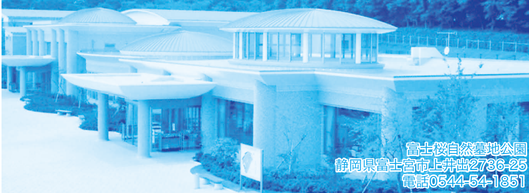
富士桜自然墓地公園 静岡県富士宮市上井出2736-25 電話0544-54-1851